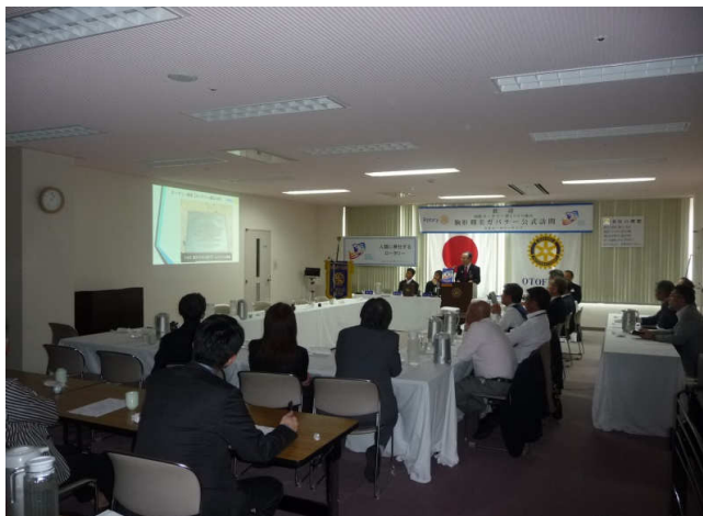
プロジェクターを使いながらゲスト講話