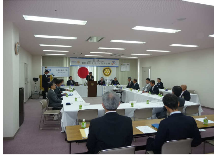
協議会～各委員会活動報告