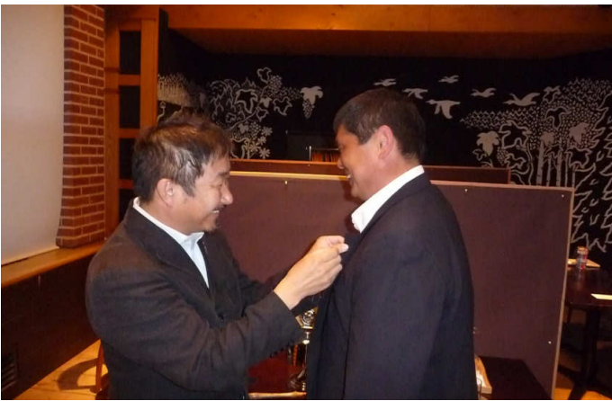
新入会員入会式 バッチ贈与