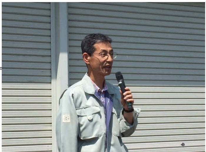
十勝エコロジーパーク合田専務理事挨拶