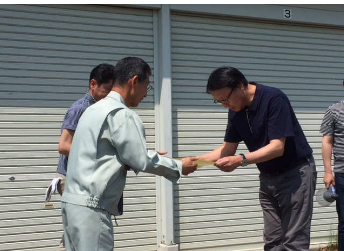
北クラブ来海会長より目録