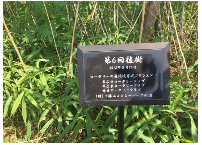
過去の植樹プレート