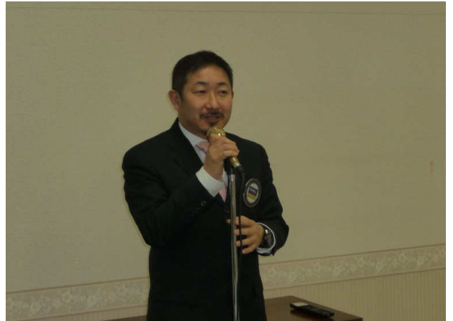
ゲスト卓話紹介・行木会員