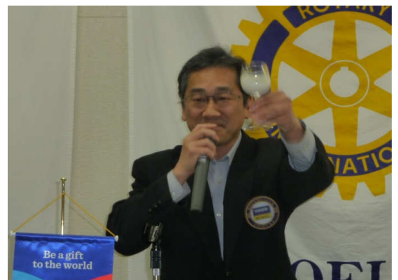
お祝いの言葉・大和会員