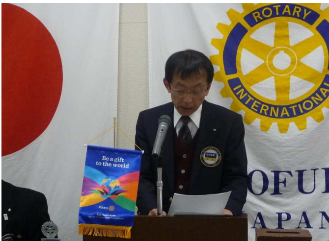
会務報告（向平会計）