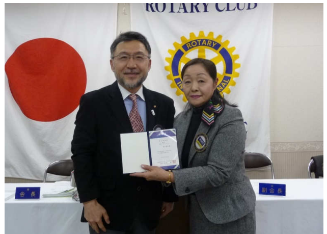
米山奨学会表彰（谷口会員）