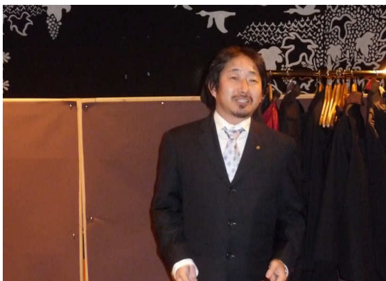
次年度会長（行木会員）挨拶