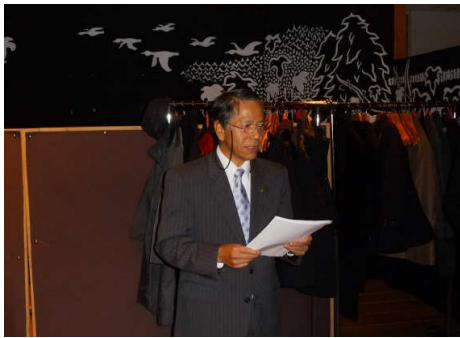
指名委員長(猪子会員)より 次々年度会長の指名報告