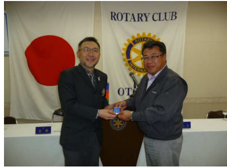
村瀬会員 記念品贈呈