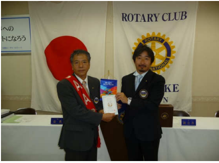
猪子会員 米山記念奨学会表彰