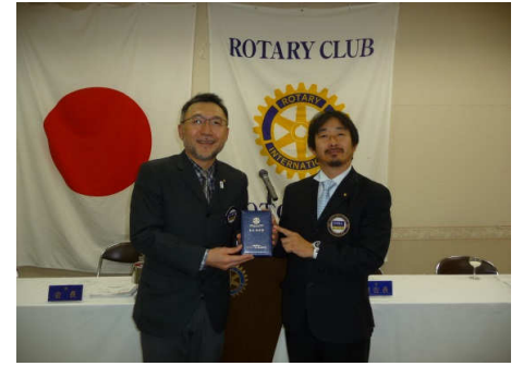
行木エレクト 米山記念奨学会表彰