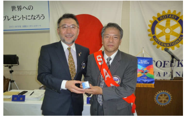
20年在籍表彰 猪子会員

平成27年10月16日（金）、17日（土）に旭川市民文化会館大ホールにて旭川北RCがホストとなりRI2500地区大会が開催されました。クラブ会報委員会よりスライドを交えてその大会参加の報告がおこなわれました。