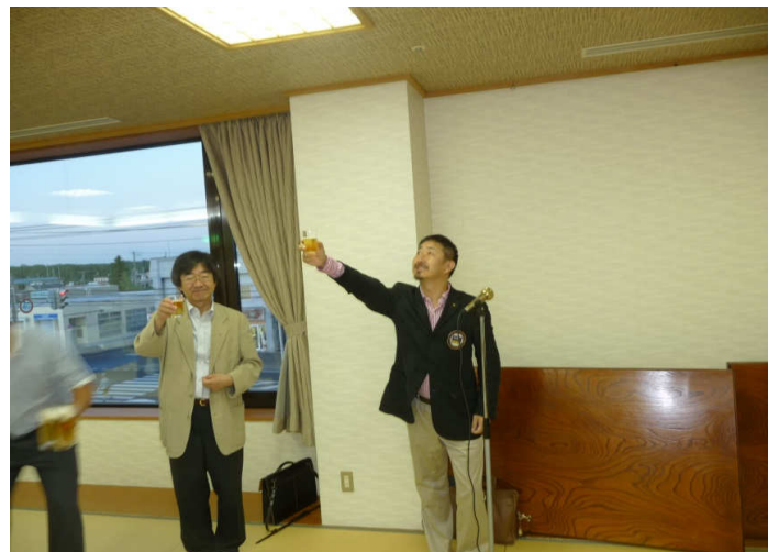
新年度親睦夜間例会 行木エレクトより乾杯