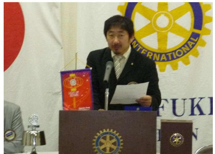
行木幹事会務報告