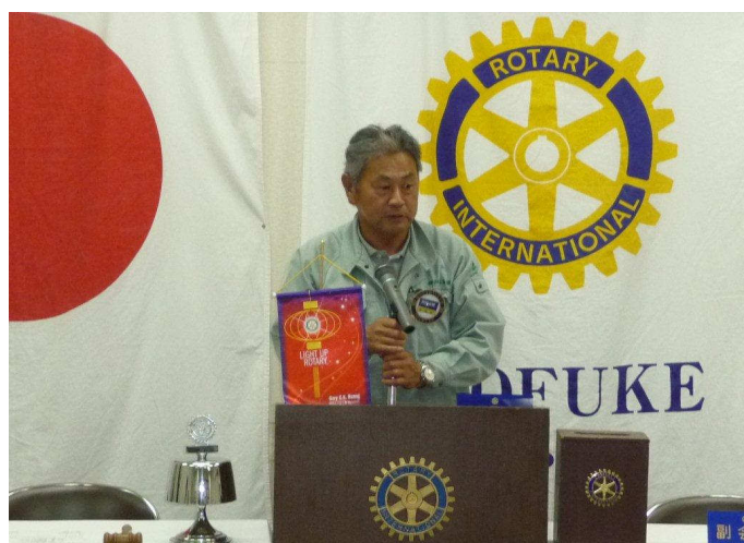
阿部会計退任挨拶