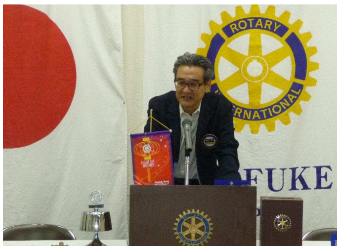
棟方ロータリー情報委員会退任挨拶