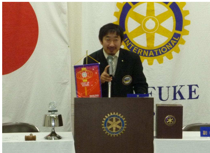
行木幹事退任挨拶