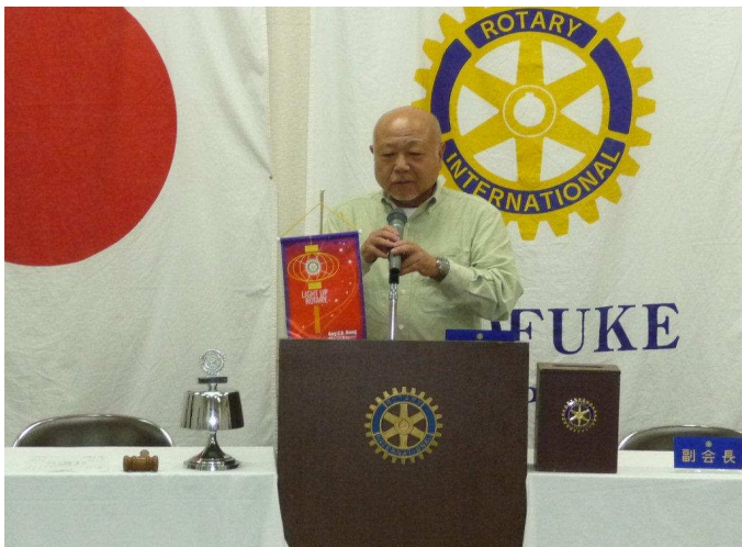
黒川国際奉仕理事退任挨拶