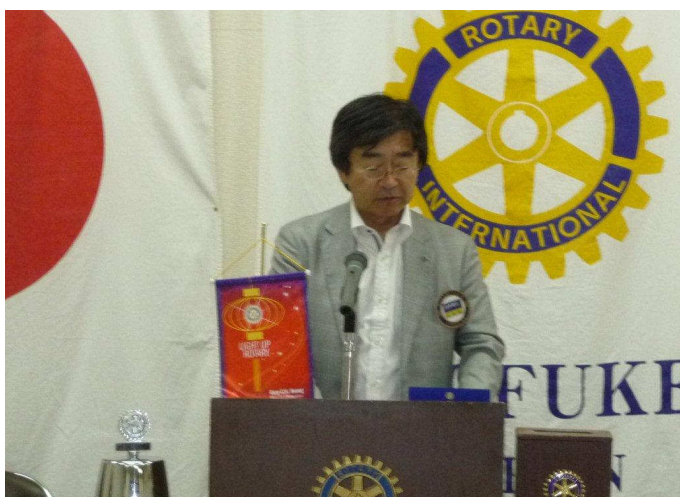
白木会長退任挨拶