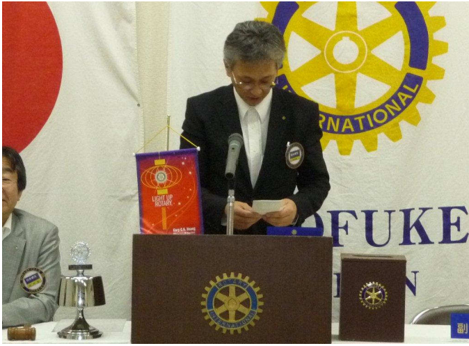
大和親睦委員ニコニコ献金報告