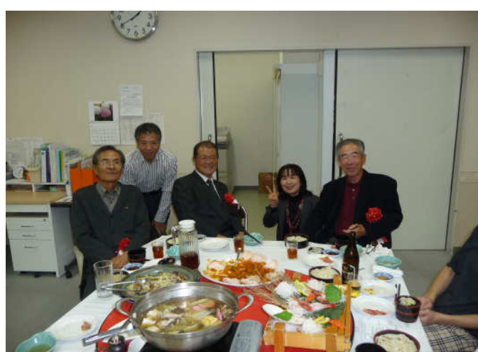
OBの皆様ありがとうございました。