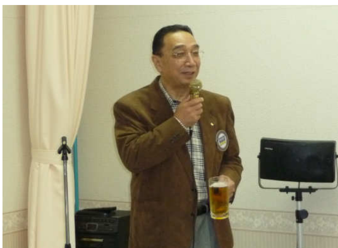
山中会員1000回記念例会乾杯