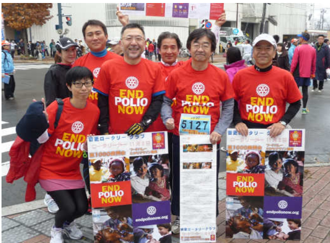
フードバレーマラソン記念撮影