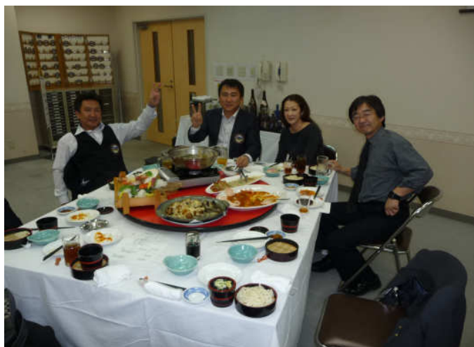
1000回記念例会宴会の様子