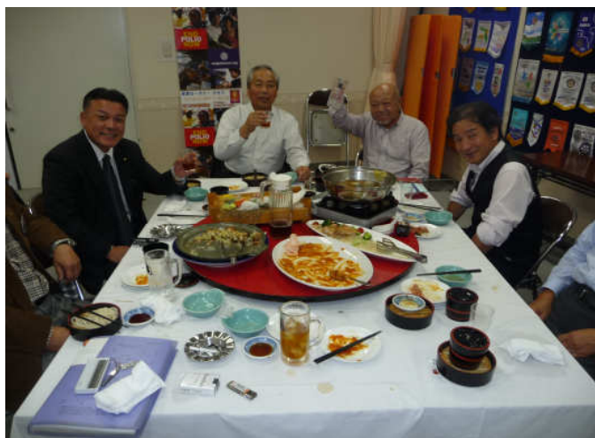
1000回記念例会宴会の様子