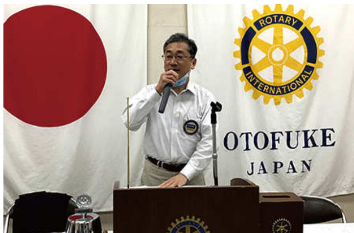
決算報告 大和会員