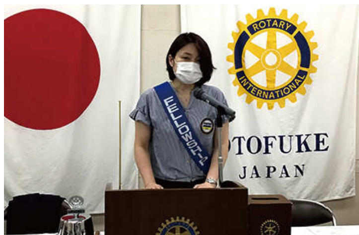
監査報告 栗栖会員