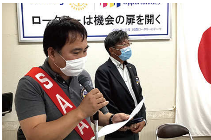
本日の進行 長屋 SAA