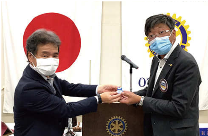
会長から若原会員へ在籍表彰（5年）