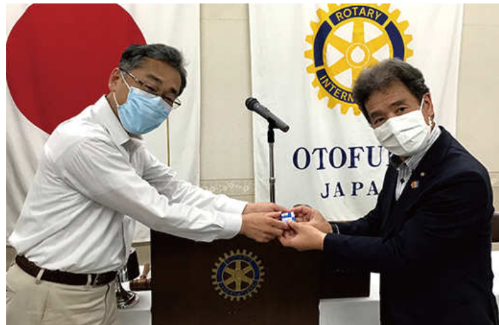
大和会長エレクトから中西会長へ在籍表彰（7年）