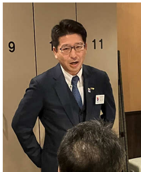
佐渡ガバナー補佐乾杯挨拶