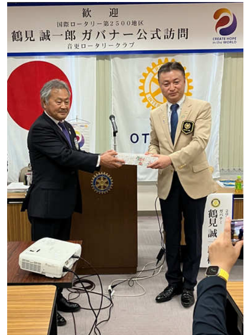
記念品贈呈 鶴見ガバナー