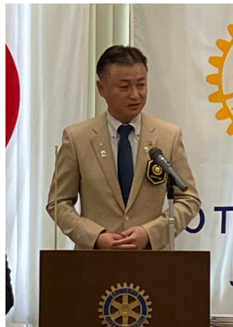
鶴見ガバナー 挨拶