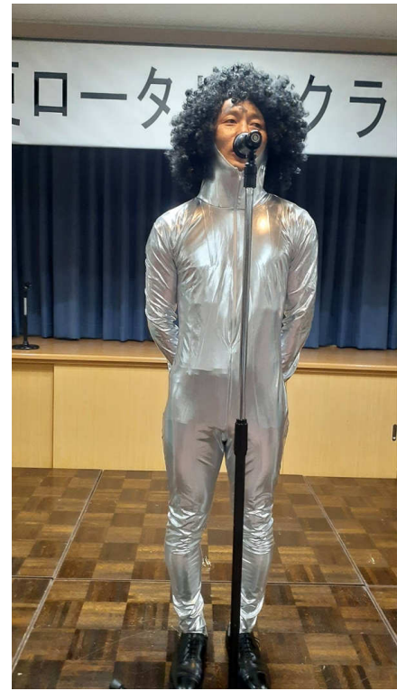
宇野親睦委員長挨拶