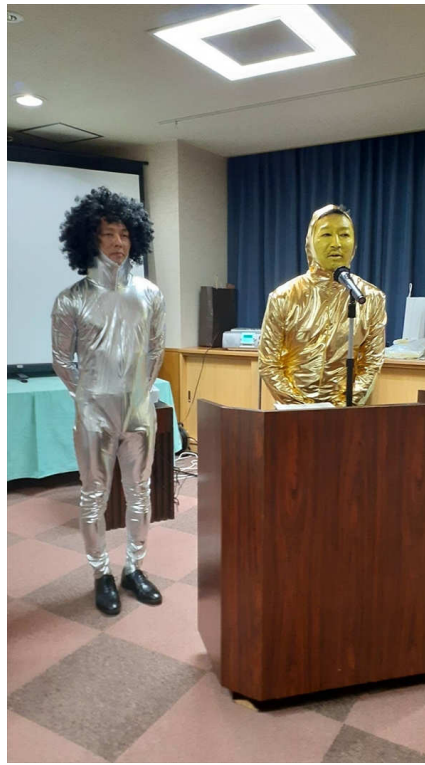
宇野親睦委員長&玉川親睦副委員長