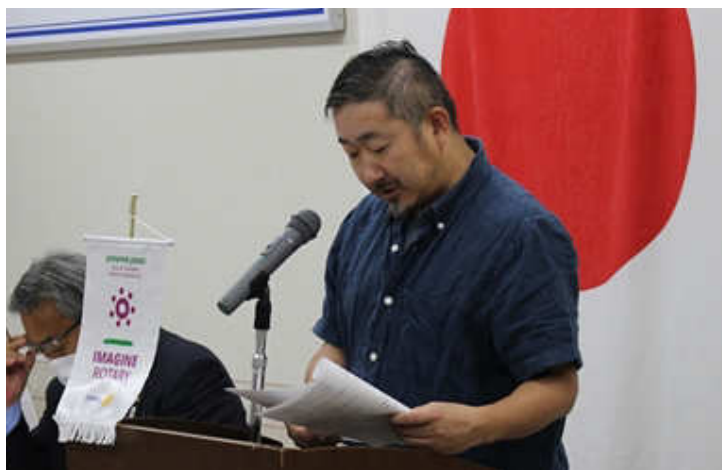
出席報告 行木出席委員長