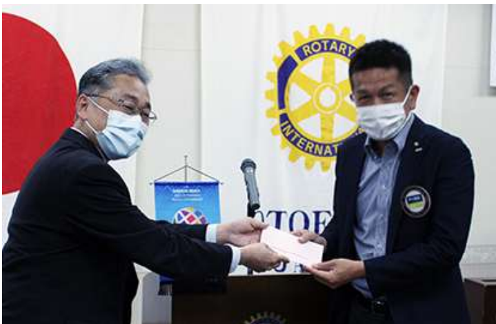
5月誕生祝い早川会員