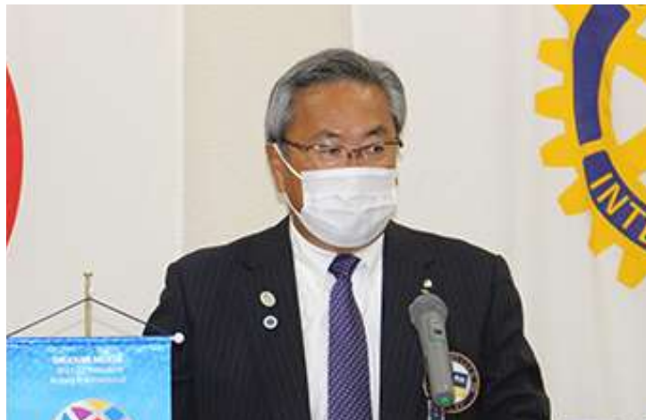
次年度会長方針発表 小枝会長エレクト