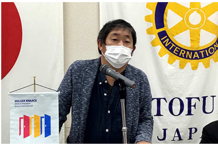
委員会報告 行木会員