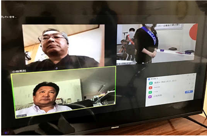
zoomで参加 小枝副会長 坂本会員