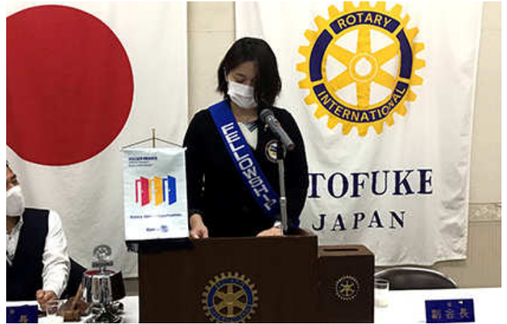
9月誕生祝 栗栖委員長