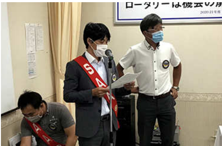
進行 宇野 SAA