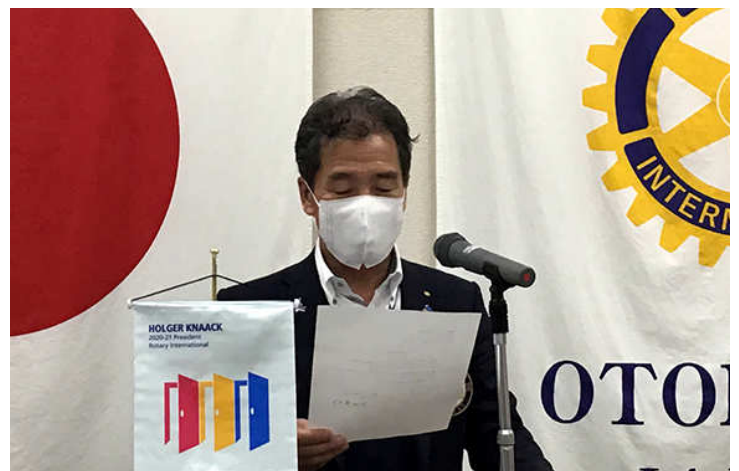
松田ガバナーから礼状を頂きました。