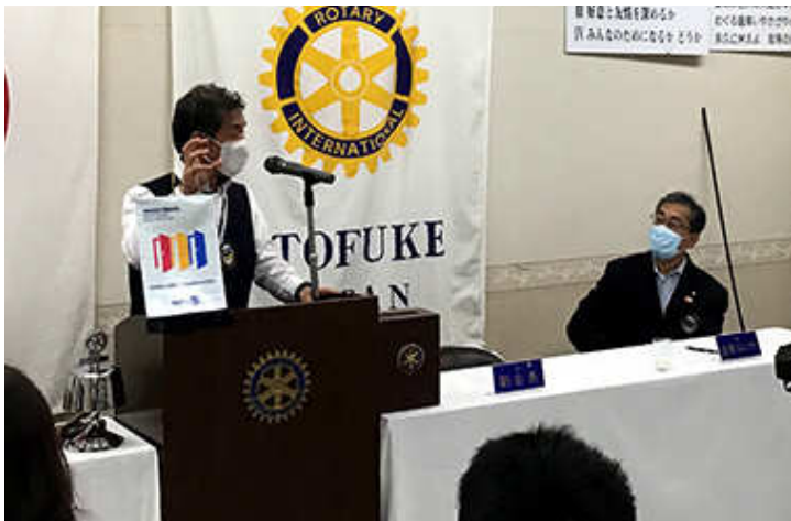
プログラム変更で自分の失敗談をお話し頂きました。