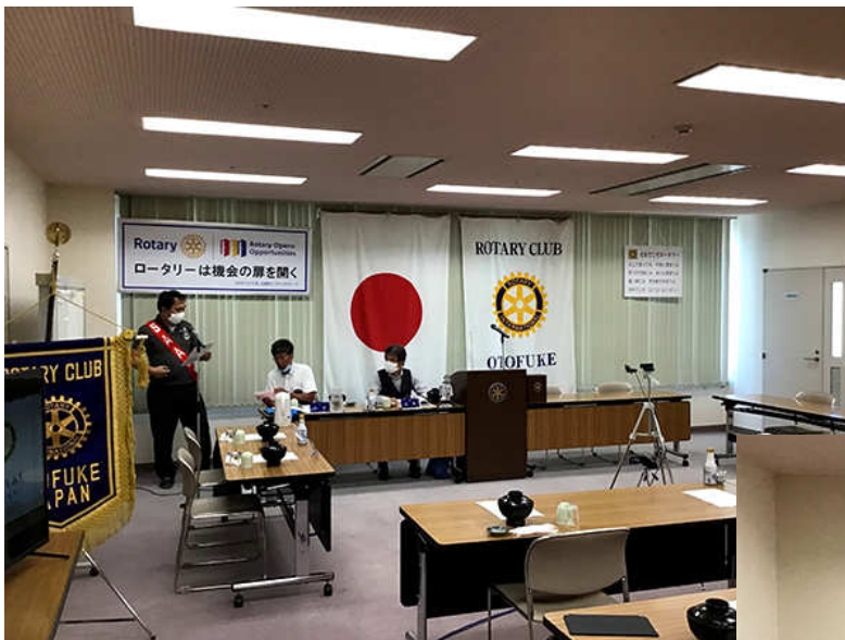
ガバナー公式訪問リハーサル準備