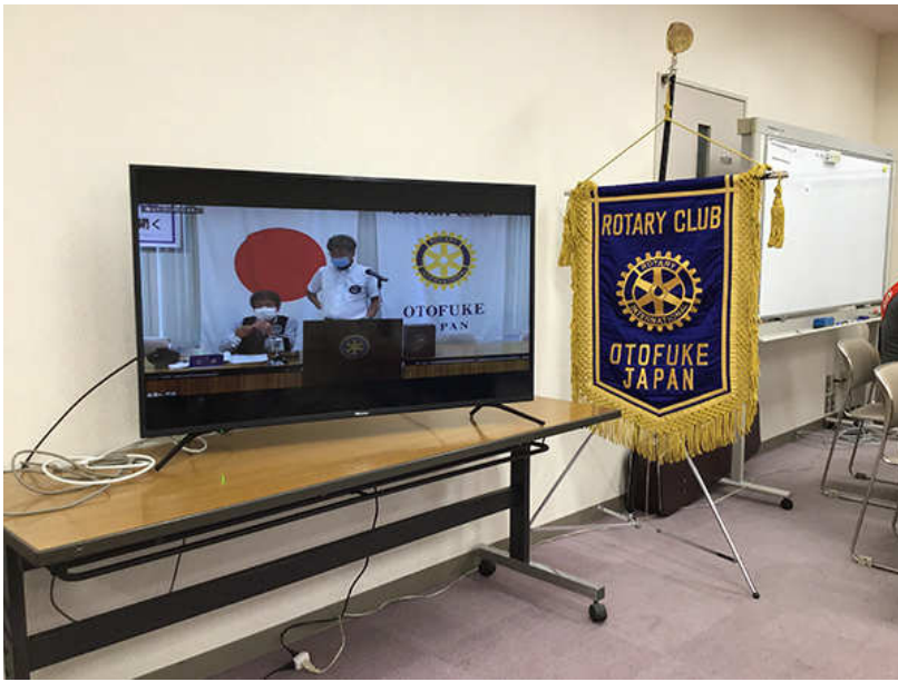
新規購入の4K 50インチ液晶テレビ