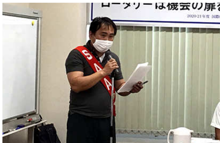
進行 長屋 SAA

各委員長様へ、委員会をズームでやってみてください。どのような形でも良いです、とりあえずやってみていただきたいと思っています。