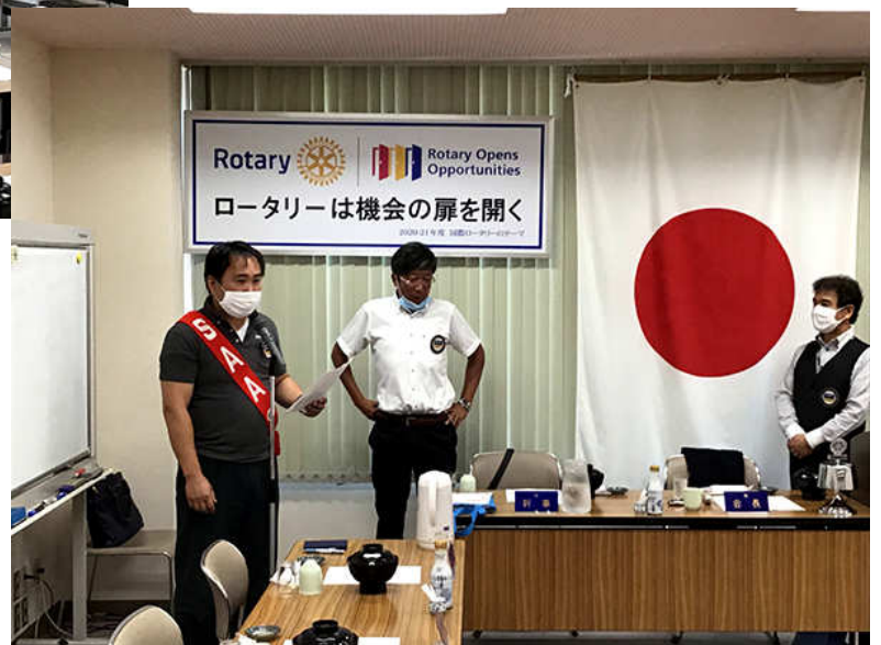
進行 長屋 SAA