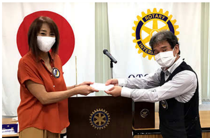
7月誕生日祝 平尾会員